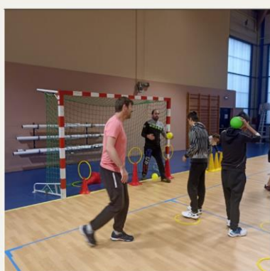
Hand Adapté Châteauneuf sur Loire