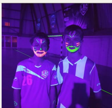
Hand Fluo Loches