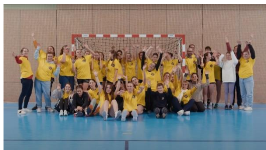
Val Sologne Handball Féminin