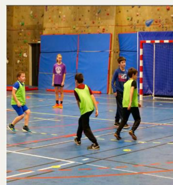
Tournoi Hand à 4 Vierzon